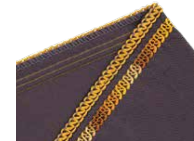
7-Faden-Expressivstich bestehend aus Dreifach-Coverstich und schmaler 3-Faden-Overlocknaht

mit Ziergarn in den Greifern: Blickfang für offene Stoffkanten