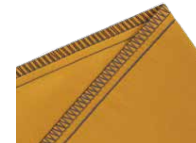
5-Faden-Sicherheitsnaht bestehend aus Kettenstich und 3-Faden-Overlocknaht

Säumen und Versäubern in einem Schritt – Standardnaht in der Bekleidungsindustrie