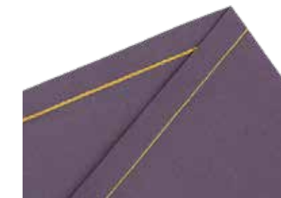
Kettenstich stabile Heft- oder Verbindungsnaht