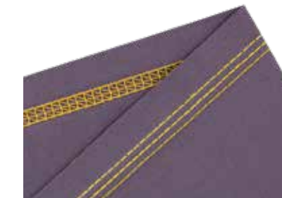
4-Faden-Coverstich für besonders glatte Saumabschlüsse