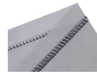
2-Faden-Flachnaht dehnbarer flacher Saum und Zierelement