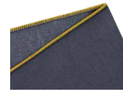
3-Faden-Rollnaht schmale Versäuberungsnah für dünne Stoffe