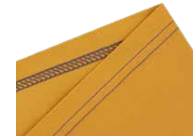
3-Faden-Coverstich für alle Arten von Saumabschlüssen