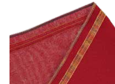
7-Faden-Expressivstich bestehend aus 4-Faden-Coverstich und 3-Faden-Rollnaht

Säumen und Versäubern in einem Schritt – Standardnaht in der Bekleidungsindustrie